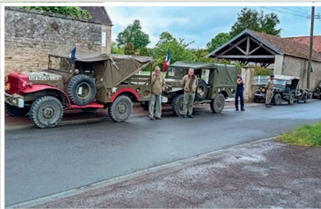
Les véhicules du site Hillman.