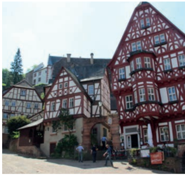
Village allemand typique

Pour ceux qui ne le savent pas, Périers-sur-le-Dan est associé à Mathieu, Cresserons et Cambes en Plaine pour le jumelage avec Gerbrunn, une petite ville de la banlieue de Wurtzburg (ville jumelée avec Caen, en photo). Gerbrunn est situé en Bavière, plus précisément en Basse-Franconie. Cette région, la Basse Franconie est elle-même jumelée avec le département du Calvados.