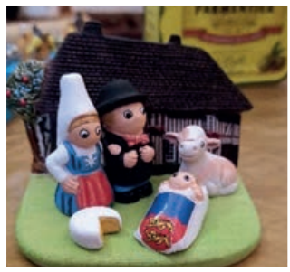
La crèche normande

Noël 2024 : Du 21 au 29 décembre 2024, 343 visiteurs sont venus admirer les crèches exposées dans le chœur de