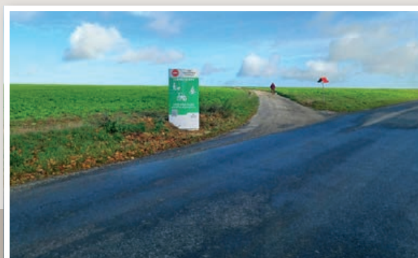
Voie douce reliant Periers-sur-le-Dan à Hermanville-sur-Mer