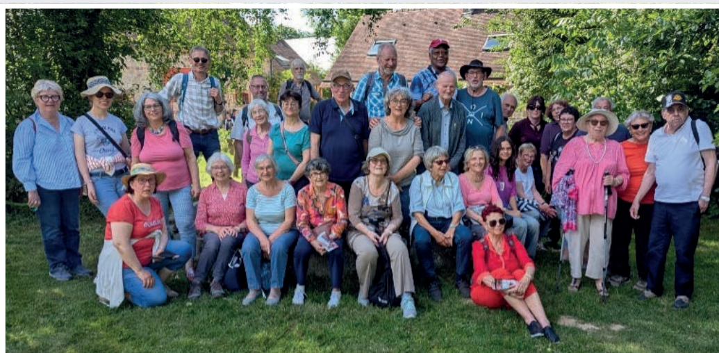
Petit groupe réuni à la ferme de la Michaudière en mai 2025

Cotisation : 10 euros pour une personne seule, 16 euros pour une famille.