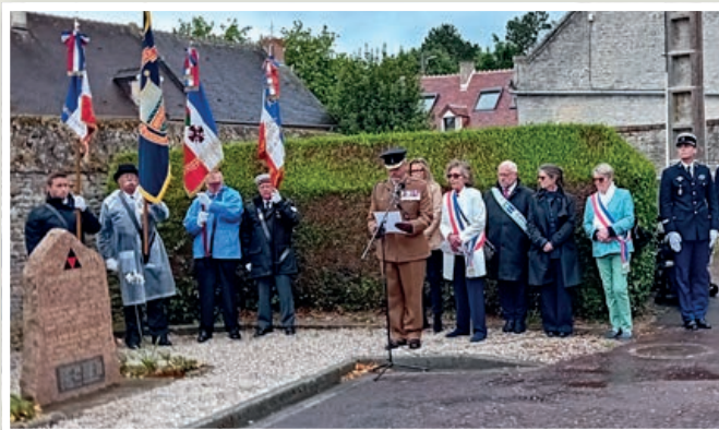
Lecture par l'officier britannique des noms des soldats tués à Périers.