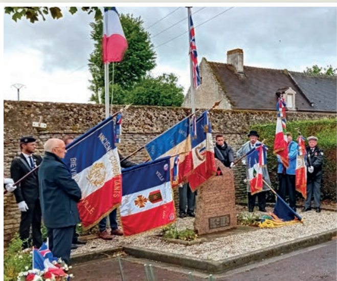
Les porte-drapeaux et Souvenirs Français.