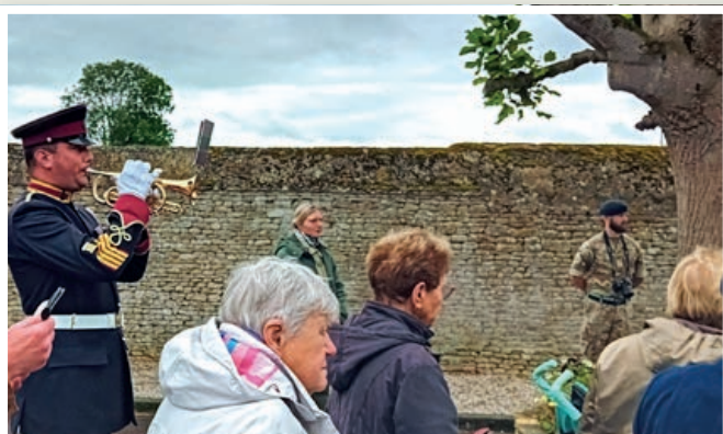
Le joueur britannique interprétant « The Lament ».