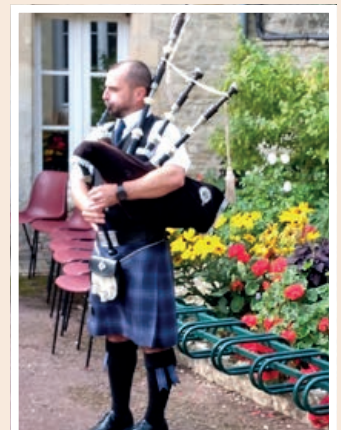
Le joueur de cornemuse

ont été récompensés par les pâtisseries offertes par Périers animation.